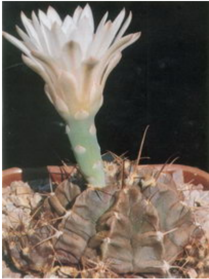
Figure 16 : Gymnocalycium anisitsii var. pseudomalacocarpus

En 2004, dans la publication Autrichienne (p. 223-232 et 245-260) Helmut Amerhauser et Hans Till ont bien été obligés de reconnaître, carte à l'appui et après "de longues études sur le terrain", que G. anisitsii et G. damsii (Fig. 13) sont bel et bien séparés géographiquement ! Leur conclusion est un ravissement pour n'importe quel splitter. Ils reconnaissent ainsi G. anisitsii , sous lequel ils rassemblent G. griseopallidum (bravo!), G. pseudomalacocarpus (Fig. 16) (double bravo!). Ils reconnaissent également la nouvelle sous-espèce boldii sous laquelle on pourra trouver les variétés G. damsii v. tucavacense (Fig. 14) et une nouvelle variété, v. volkeri Amerhauser.